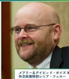
メアリー&デビッド・ボイス 米国 外交政策特別シニア・フェロー ジェームズ・リンゼイ