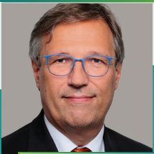
ディレクター ステファン・マイヤー